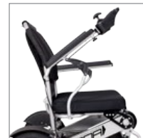
Reposabrazos abatible. Folding armrest.