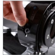
Indicador forntal de carga de batería. Front control battery status.