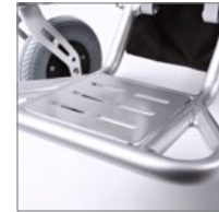
Reposapiés abatible. Folding footrest.