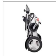
Fácil de transportar. Plegable. Easy to transport. Folding frame.